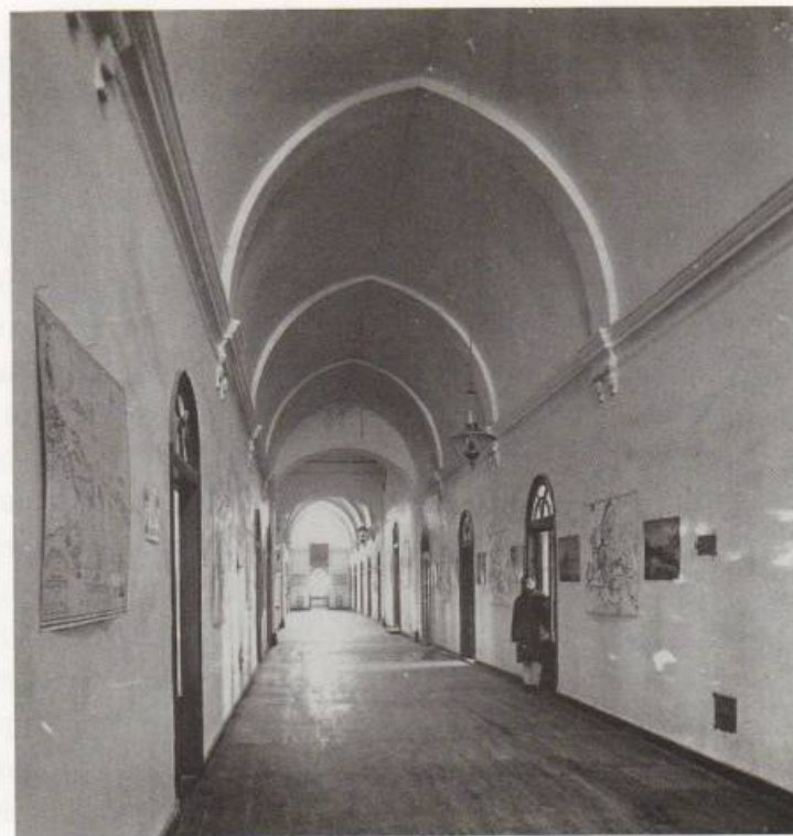
Գևորգյան ճեմարանի միջանցքը երկրորդ հարկում (1880)

Բոլորը բարի ու քաջ մտածուած կարգադրութիւններ: Մակայն ցաւելով պէտք է ասել, որ օրէնքը գործադրողներից և նոյն իսկ Կաթողիկոսին շրջապատողներից ու մերձաւորներից շատերը, որոնց վստահացած էր Կաթողիկոսը, փոխանակ նորա դրած կանոնների ճիշտ գործադրութեանը հսկելու, այդ կանոնները դարձրին մի առժամանակ սիմոնականութեան (57) աղբիւր: Կանոնական կոնդակով ժողովրդի քահանայ ընտրելու իրաւունքը վերահաստատուած էր: Այս հանգամանքի ճիշտ գործադրութեանը հսկելու միջոցն ունէր Կաթողիկոսը. մէջտեղում պիտի լինէր ժողովրդի հանրագիրը ստորագրուած ու պետական կնիքով վաւերացուած, որ և Կաթողիկոսը միշտ, հարկը պահանջելիս պէտք է տեսներ: Այստեղ խաբէութիւն անելը դժուար էր. խաբողն ու կեղծողը օրէնքի խստութեամբ կարող էր պատժուել: Մակայն այդպէս հեշտ չէր Կաթողիկոսի համար անձամբ վերահասու լինել կանոնների միւս երկու կէտերի գործադրութեանը: