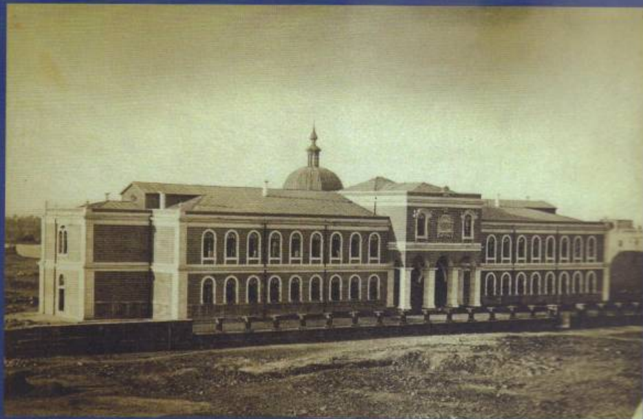
ԳԵՎՈՐԳՅԱՆ ՀՈԳԵՎՈՐ ՃԵՄԱՐԱՆ (1874)