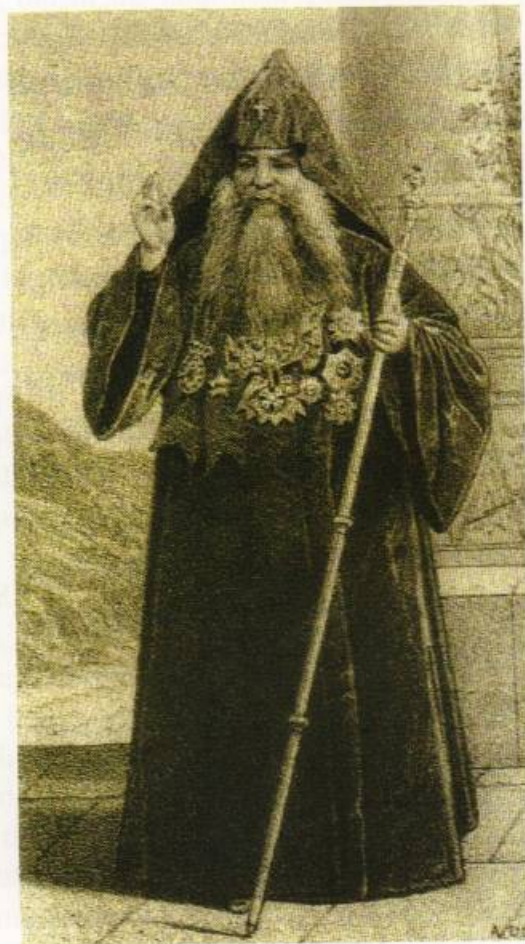
Կաթողիկոս Ամենայն Հայոց Գևորգ Դ. Քերեստեճյան

Իսկ եթէ դառնանք Ռուսաստան, խիստ բազմաթիւ են Հայրապետի գալստեան ժամանակ և ապա Ս. Պետերբուրգ գնալիս ու գալիս և ուրիշ ճանապարհորդութիւնների ժամանակ, յայտնի ու կրթուած մարդկանց կարդացաց ուղերձները. բոլորը փքոցուտոյց ու ճարձատուն բառերով և նոյնն են ասում՝ Կաթողիկոսին, ինչ որ Կ. Պոլսի խմբագիրները: Նոյնը յիշեցնում են նորան և նշանաւոր հայագն մարդին նամակներով: Ամենից պարզ արտայայտուած է այդ բաղձանքը 1870 թ. մայիսի 24-ին Թիֆլիսում Կաթողիկոսի օժման տարեդարձի օրը կարդացուած մի ուղերձի մէջ: Ստեփանոս աւագ քահանայ Մանդինեան (27), կրօնագիտութեան և հայոց եկեղեցականութեան ուսուցիչը Ներսիսեան դպրոցում, ասում է այդ ուղերձի մէջ. «Երից իրաց պետս ունիմք՝ շինութեան և բարեկարգութեան եկեղեցոյ ի վերայ սկզբնական հիմանց իւրոց, բարեկարգութեան հոգևորականաց և հիմնելոյ ուսումնարանս, ուր գոն պակասութիւնք, և գեղեալսն որչափ մարթ է, ըստ ներելոյ միջոցած պահպանել և կանոնաւորել»: Ահա երեք պահանջներ, որ շարունակ կրկնուում են Հայրապետի ականջին և իբրև պարտք դնում են նորա վերայ ամեն մի առիթը պատահած ժամանակու ամեն տեղ և՛ խմբագիր, և՛ ուսուցիչ, և՛ ամեն կրթուած մարդ: Եւ մենք կարող ենք ասել, որ մեր Հայրապետն այդ պահանջները իրագործելուն իսկապէս նուիրել է յարատն իւր բալոր ժամանակն ու ջանքը և կարող էր իրաւամբ պատասխանել Կ. Պոլսի խմբագիրների ուղերձին.