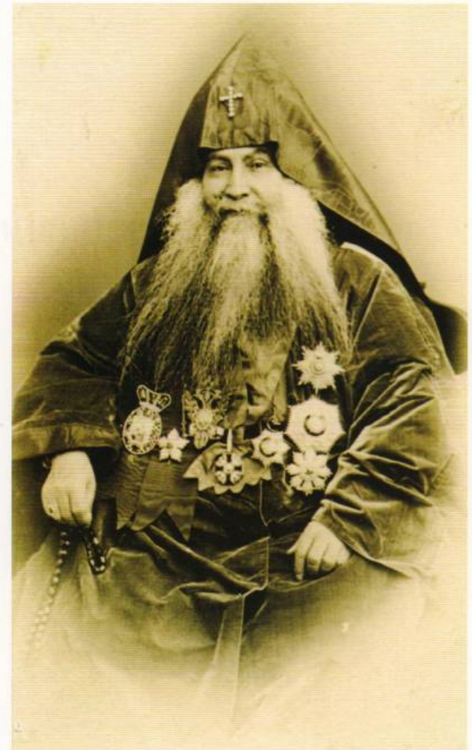
ԳԵՎՈՐԳ Դ ՄԵԾԱԳՈՐԾ ԿԱԹՈՂԻԿՈՍ ԱՄԵՆԱՅՆ ՀԱՅՈՑ

ISBN 978-9939-59-142-1 © Մայր Աթոռ Սուրբ Էջմիածին, 2014