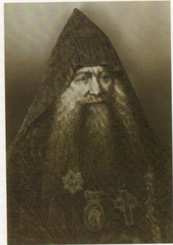
Գևորգ եպիսկոպոս Քերեստենյան (Կ. Պոլսի Հայոց պատրիարք)

Հեշտ ժամանակում չէր կոչուած Գէորգ եպիսկոպոսը պատրիարքութեան պաշտօնին: Մատթէոսի վերջին տարուց արդէն, ինչպէս ասացինք, հաստատուած էր մի տեսակ սահմանադրական վարչութիւն՝ Հոգևոր և Գերագոյն ժողովներով, որոնց անդամներն երկու տարին մի անգամ պետք է փոխուէին: Բայց գրեթէ ամեն անգամ էլ ընտրուում էին նոյն մարդիկը, որոնք կարծես, սեփականել էին ազգային վարչութիւնը: Սահմանադրութիւնը շատ տարրական էր և առանց որոշ կազմակերպութեան ու կանոնադրու-