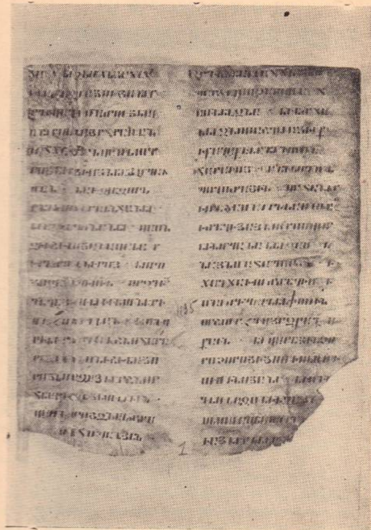
էջ Ազաթանգեղոսի «Հայոց պատմություն»-ից (Մկրտչի Մաշտոցի անվան Մատենադարան, № 1195 պատտիկ, Բ—Ժ դար)

© Երևանի համալսարանի հրատարակչություն, կազմելու և թարգմանության համար, 1983