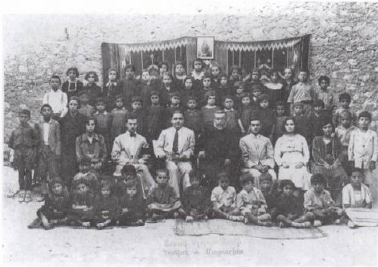
Քերթուկի խրիմեան վարժարանի երկսեռ աշակերտները, նկարուած 1932-ին: