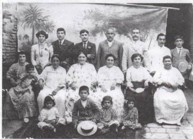
Խմբանկար Պասրայու քանի մը ընտանիքներու, առնուած 1914 Նամաշխարհային պատերազմէն առաջ: