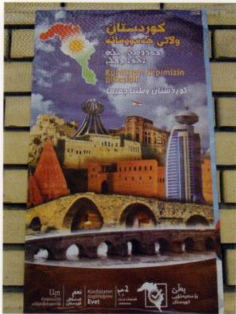
2017 թվականի սեպտեմբերի 25-ի անկախության հանրավեժի գովազդային պաստառներից