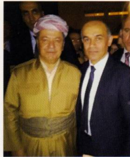
Վահրամ Պետրոսյանը Քուրդիստանի նախագահ Մասուդ Բարզանու հետ (2018)