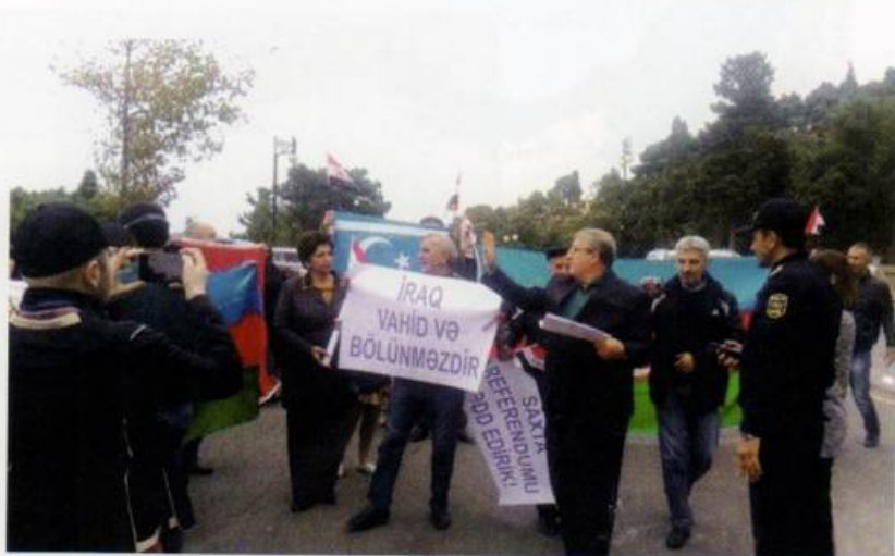
Քուրդիստանի անկախության հանրաքվեի օրը Ադրբեջանում կազմակերպված բողոքի ցույցերն Իրաքի թուրքոմանների մասնակցությամբ (25.09.2017)