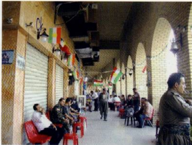
Քուրդիստանի անկախության հանրավեժի օրը (Էրբիլ, 25.09.2017)