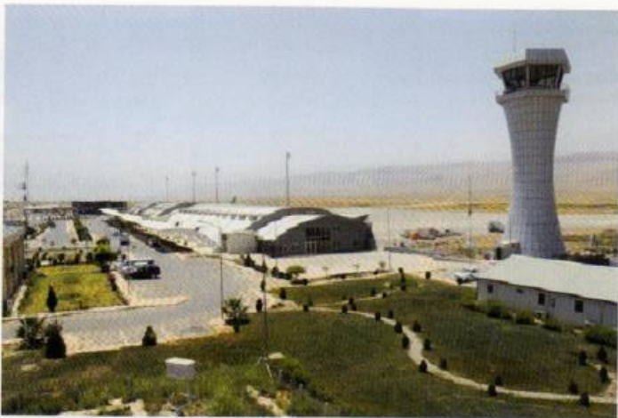
Սուլեյմանիեի միջազգային օդանավակայանը (2015)