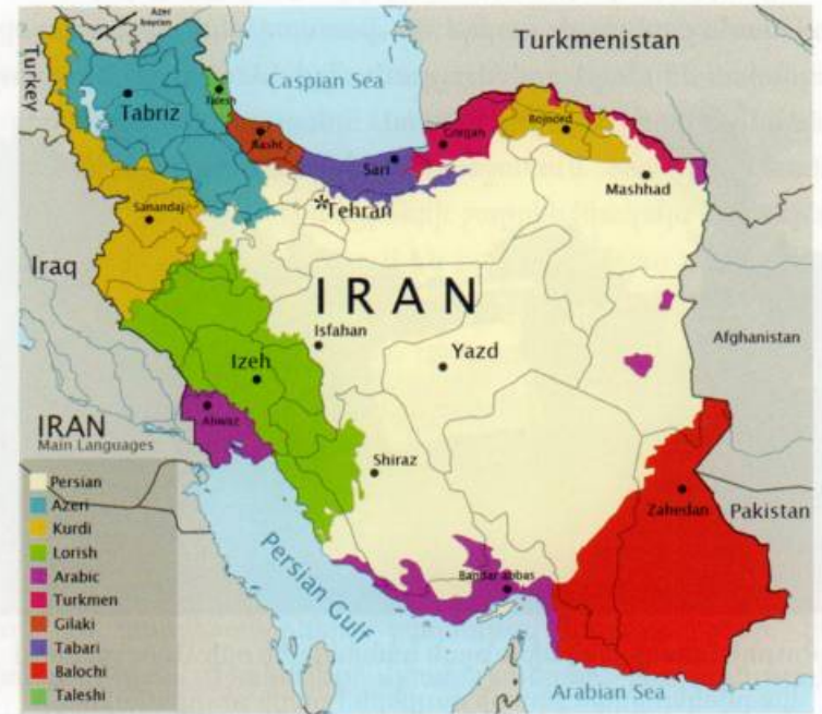
Իրանի Իսլամական Հանրապետության քարտեզը՝ ըստ լեզվակիրների տեղաբաշխման