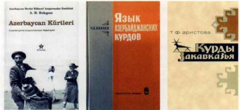
Ադրբեջանի քրդերին նվիրված մի շարք աշխատություններ