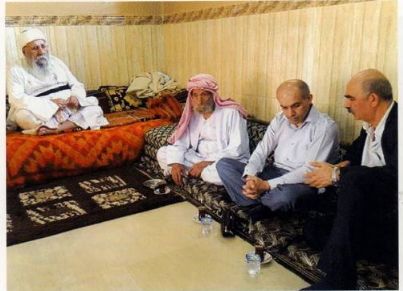
Հանդիպում եգիպտացիների հոգևոր առաջնորդ Բարաշեյխի հետ (2018)