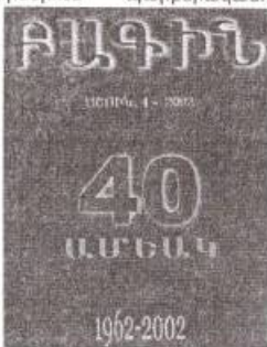
ամսականէն վերածուած է

պարբերականը, սկիզբը որպէս վարիչ-խմբագիր Կարո Սասունիի օգնական, ապա՝ խմբագիր: A-4: Ծաւալը փոփոխական է՝ ընդհանրապէս 150 էջի սահմաններուն մէջ: Հեռաձայն՝ 258526, հասցե՝ «Շաղղոյեան» Կեդրոն, Պուրճ Համմուտ: Բովանդակութիւնը հիմնականին մէջ հայկական գրականութիւնն է. կան նաեւ օտար հեղինակներու գործերի բարգմանութիւններ: