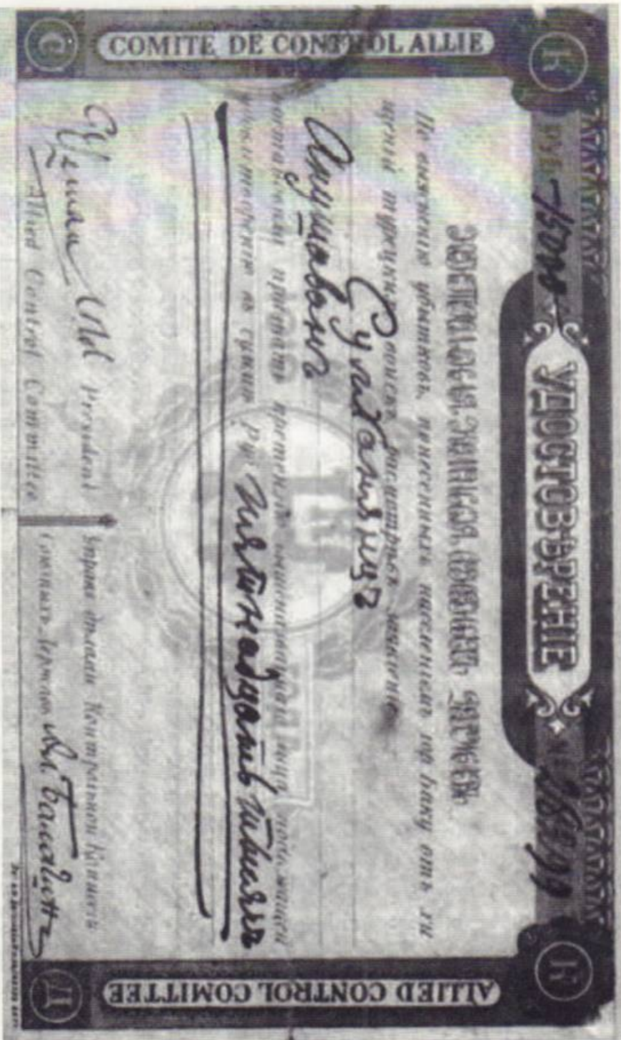
Վերստուգիչ հանձնաժողովի կողմից տրամադրված փոխապատրաստման չեկ: Պահպանվում է ՀՀ Ազգային արխիվում

ԽՍՀՄ . դեկավարության և Աղբբեջանական ԽՍՀ շահերը դեռ մեկ անգամ էլ պիտի համընկնեին, ու խորհրդային զինուժը պիտի իրականացներ «Կոլցո» գործողությունը, բռնագավթեր Դաշտային Ղարաբաղը և նվիրաբերեր աղբբեջանցիներին: Դեռ պիտի պատերազմ սկսեին Արցախի դեմ և հարձակվեին Հայաս- տանի սահմանների վրա: Դեռ պետք է «Գրադ» կայաններով ոմբակոծեին և ինչպես 1918 թվականին՝ իսկին անմեղ ծերերի, կանանց ու երեխաների կյանքը: