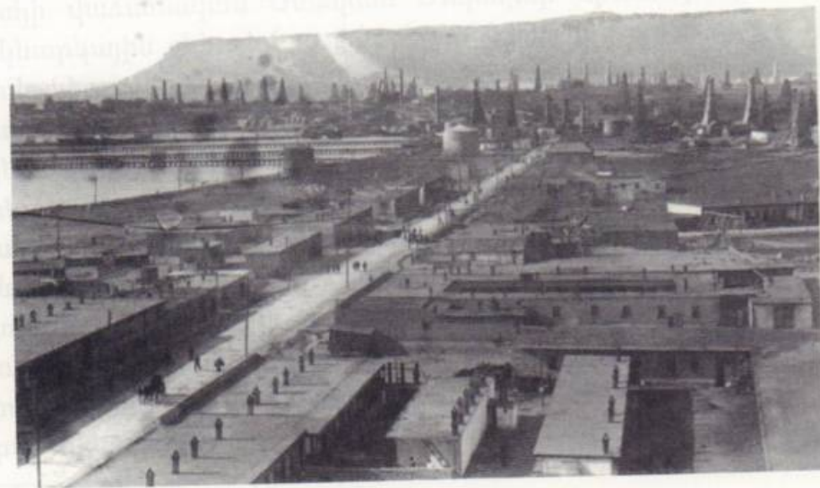
Բաքվի նավթարդյունաբերական տեսարան