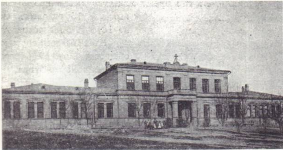
Մարդասիրական ընկերության Գ.Թումայանի և Խ.Ավան-Յուզբաշյանի անվան որբանոցի շենքերը

խոսքը. կապիտալիստական հասարակարգում կա երկու հիմնական դաս՝ գործատու ու գործավոր, և «շահագործումը» կատարվում է կամավորության սկզբունքով՝ առանց ռասայական կամ կրոնական խտրականության: Բայց ծագում է մեկ այլ հարց՝ ինչո՞վ պիտի զբաղվեր աշխատել չսիրող, աշխատելու անընդունակ աղքեջանցին: Միայն մեկ բանով՝ կուտակել նախանձ, չարություն, ատելություն և այլը տնկել ուրիշի աշխատանքի արդյունքին: Ահա սա՛ էր աղքեջանցու էությունը, սա՛ էր նրա ավագակաբարոյության հիմնական պատճառը: