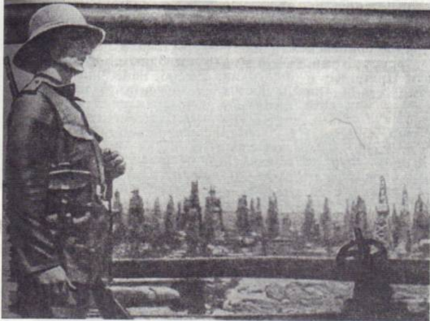
Անգլիացիները Բաքվում: 1918թ. նոյեմբեր