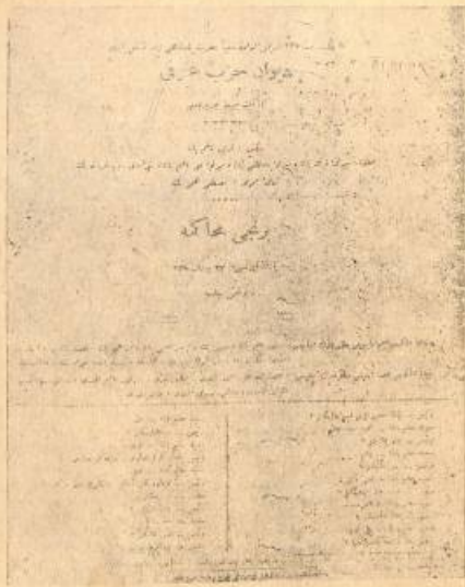
Յրիմաստանի գաղութարարական ղեկավարների և շրջապատի զինվորների (Միսթյան և Կառապետյան) կառավարման կենտրոնական կազմի սկզբնական գաղութարարական առաջին կետի (27 ապրիլ 1818 թ.) արևմտագրության սկզբնաձևը: