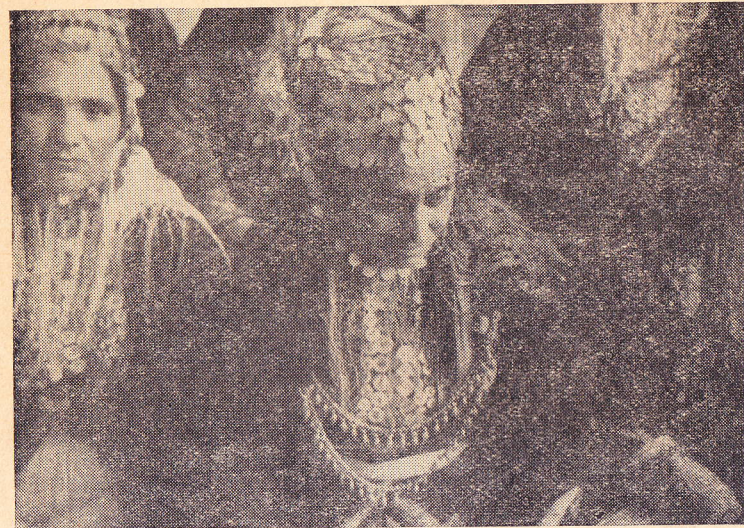
Նկ. 1. Մի խումբ քրդուհիներ Թալինի շրջանի Թըլիկ գյուղից

Եթե եզրի քրդերից որեւէ մեկին մեղադրում էին հանցանքի մեջ, ապացուցելու համար, որ ինքը հանցագործ չէ, ծերակույտի ներկայությամբ նա վերցնում էր մերկացրած թուրը և առավոտյան շուտ դիմավորում արևի ծագումը։ Նա չոքում էր Շամսի առաջ և ապա երգվում էր, որ հանցագործն ինքը չէ, այլ նրան զրպարտել են թշնամությամբ և դիմելով Շամսին, ավելացնում՝ «Շամս, եթե այսինչ հանցագործությունը ես եմ արել, թող այս սուրը կտրի