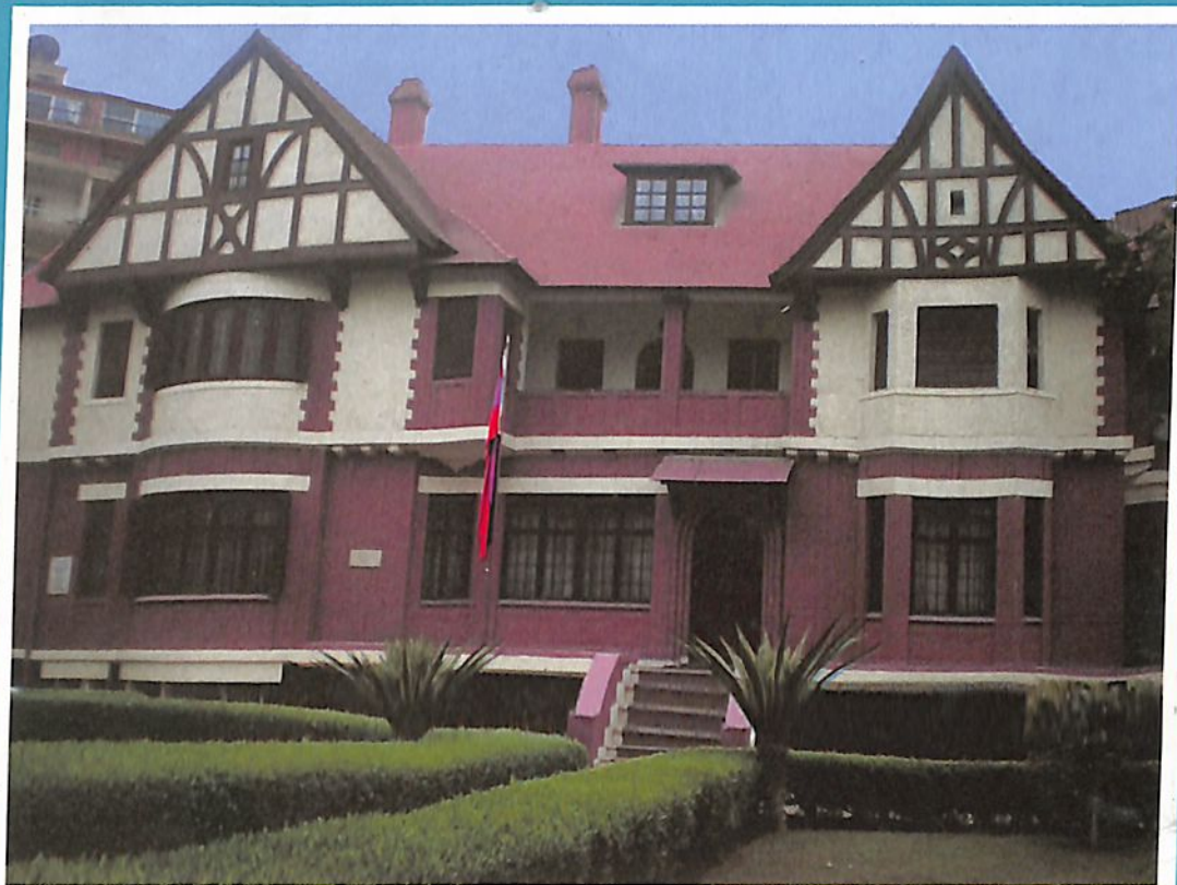
ՀՀ Եգիպտոսի դեսպանատան նստավայրը