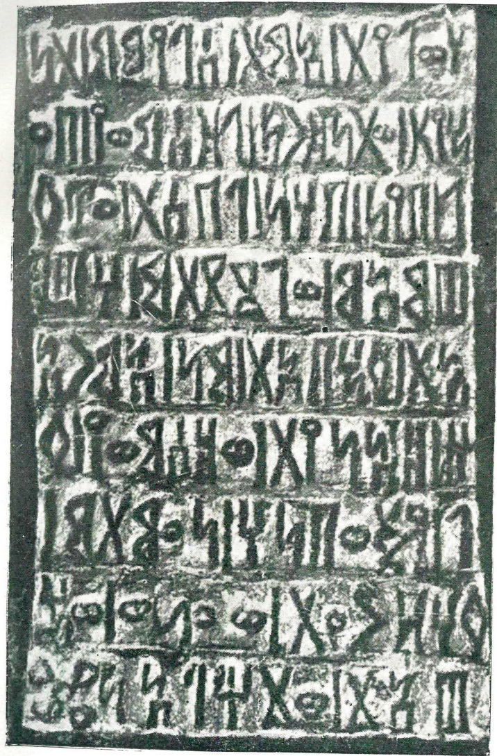
3. Бронзовая сабейская табличка (V,1).

С первыми откликами на публикацию страхи быстро рассеялись. Небольшое количество специалистов помогло тому, что все сабеисты в той или иной форме отозвались на новую находку. Она еще раз показала всю международность науки в нашей области. Крупнейший представитель ее, бельгиец, посвятил на-