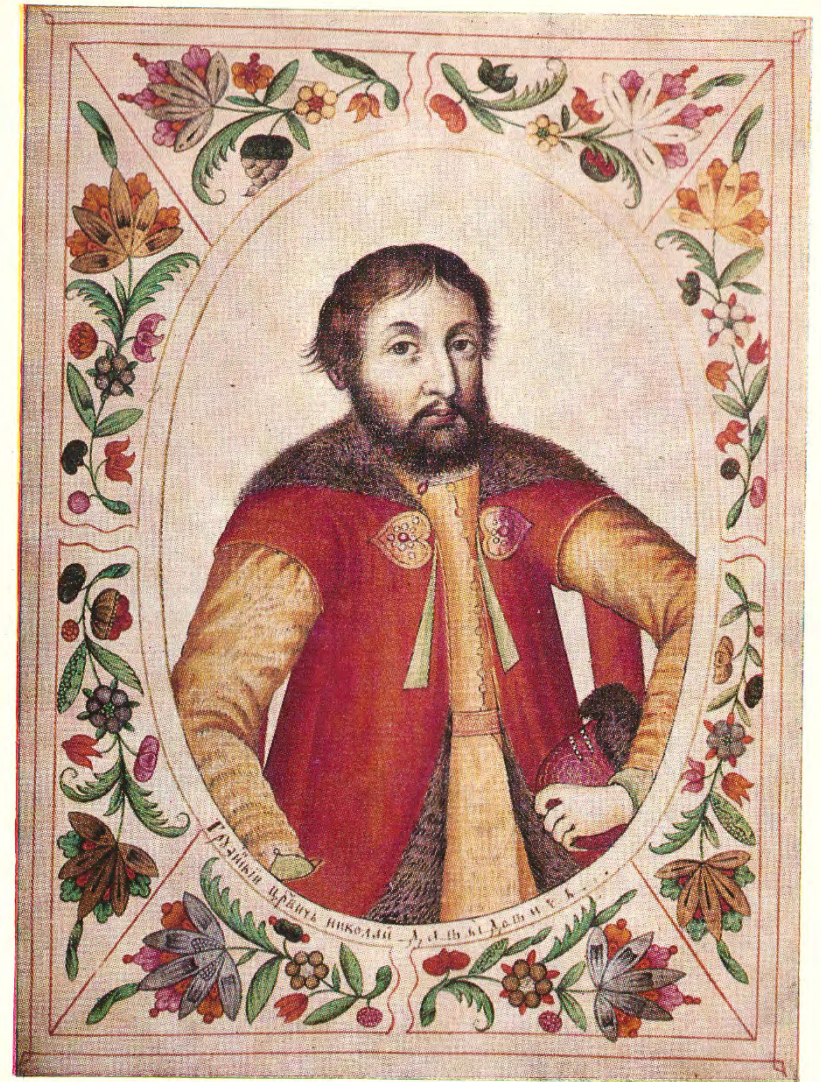
Грузинский царевич Николай Давидович, впоследствии грузинский царь Ираклий I.

А как царевич был у великого государя на дворе на приезде и ему было 3 встречи.