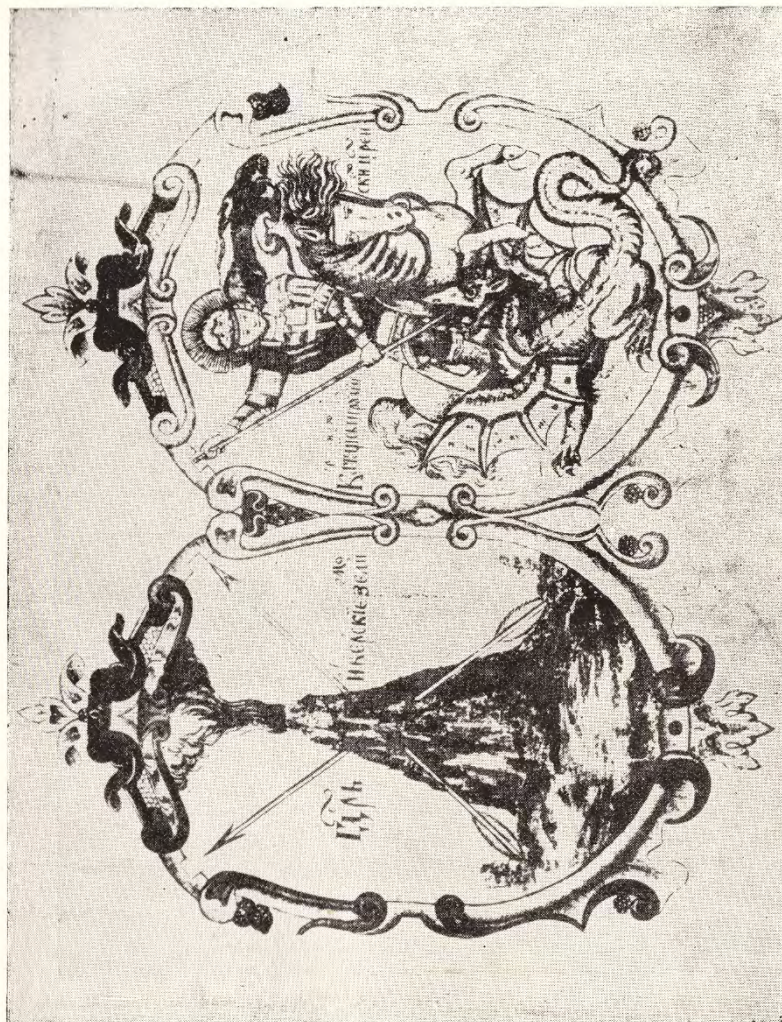
Герб восточногрузинских царств (Картли и Кахети), нарисованный в «Большой государственной книге»