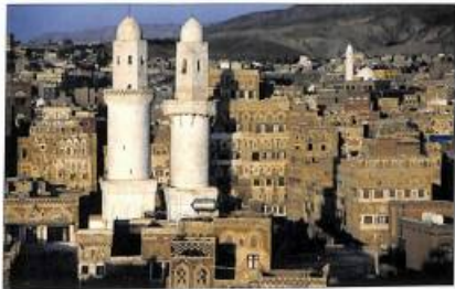
Իննը մայրաքաղաք Ասևան