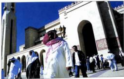
Ըստրեյնի մեծ նշվիթը