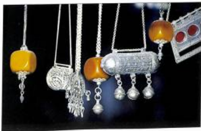
Իննը ոսկեխեցերի գործերից