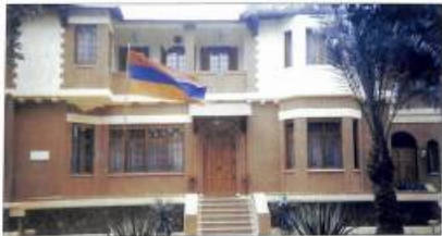
ՀՀ ղեկավարումը եղիպատում