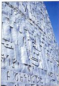
Նայեց զրնը, Անքանդրկաի զատարանի պատին