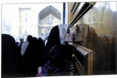
Իրաքի կինը համբուրում է շիալան կրթականի դուռը