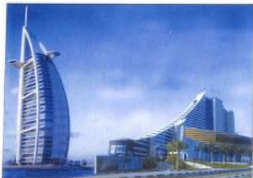
Դուբայ: «Բուժը ալ-Ալաք» քարձրանալող հյուրանոցային համալիրը