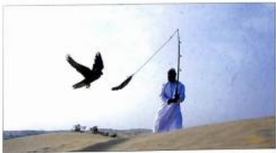
Ուստրո-քաղցի մարդուք ԱՄՆ-ում