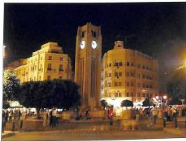
Երեւանի Քեչուր. Մատի Խրատարանը