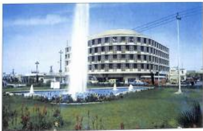
Իրաք. տեսարան Մուսկլ քաղաքից