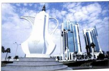
Ինքնատիպ կտրուկ Դոհայում