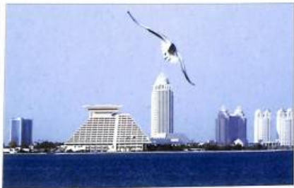
Տեախան Կատարի մայրաքաղաք Դոհայից