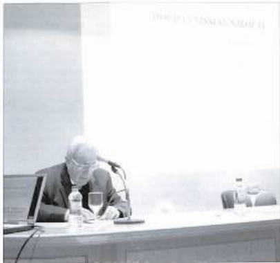
Լ. Գոլիաննիսյանի ելույթը կենտրոնադիպում Իսպանիայի Վալենսիայի Գիտությունների և Գեղարվեստագիտությունների կենտրոնում, 9 փետրվարի, 2008 թ.

Հ այաստանի գիտության վաստակավոր զորնիչ, Հայաստանի գիտությունների ազգային ակադեմիայի արևելագիտության ինստիտուտի տնօրեն, պատմական գիտությունների ոլորտը պրոֆեսոր Կոնձիլյանների լուծման Հայաստանի Կենտրոնի հիմնադիր տնօրեն և Հայ-ատլանտյան ասոցիացիայի նախագահ: Նյու Յորքի գիտությունների ակադեմիայի, Ազգային անվտանգության հիմնախնդիրների գիտությունների միջազգային ակադեմիայի (Մոսկվա), «Արարատ» գիտությունների միջազգային ակադեմիայի (Փարիզ), Բնության և ինստրակտության մասին գիտությունների միջազգային ակադեմիայի իսկական անդամ, Սիրիայի սրբաբանական գիտության պատմության ընկերության (Դալեայ) անդամ և Ամերիկյան կենսազբաղված ինստիտուտի հետազոտությունների վարչության խորհրդական: