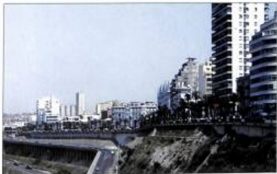
Աճյուր, մալբարտաքաղաքի պողոտաներից մեկը