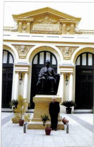
Տոյելիս հելինակը Ալեքսանդրիայում՝ եգիպտոսի առաջին վարչապետ Լուսար Լուսարյանի հրաշարմանի մոտ