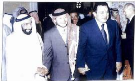
Չախից աջ ԱՄՆ-ի նախագահ չեյն Չախիցը, Բորդանանի բաժնավոր Արապյան Թ-ը & Եգիպտոսի նախագահ Մուբարակը