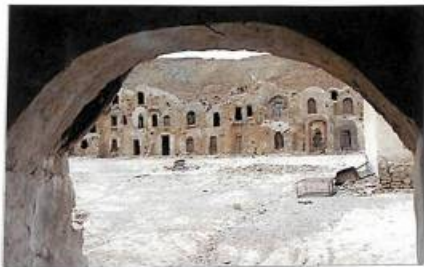
Հին քաղաքի անբազկները Թուրքում