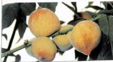
ԱՍԷ. անասլանի հատվածը աշխարհում մալթոն