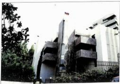
ՀՀ ղեկավարությունը Կիբանյում