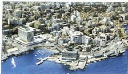
Լիբանանի մադրասադար Քեչուրի շնչհանուր պատկերը