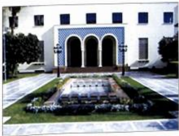
Արաբական պատկերացումների լիզայի շնիթը եզմապատում