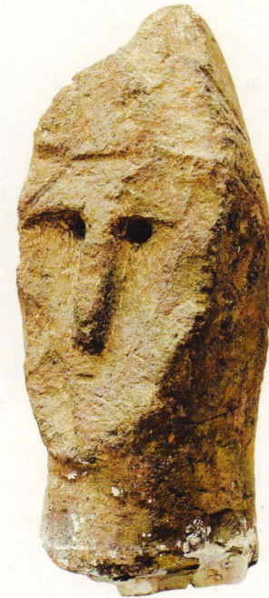
ԴԻՄԱՔԱՆԴԱԿ - ԿՈՒՌՔ ք.ա. X - IX դդ. Դվին, սուֆ, 56 x 30 x 23 սմ ՀՊԹ № 3078

Տղամարդու դիմաքանդակ է: Գլխին կրում է սրագագաթ սաղավարտ: Դեմքը օվալաձև է՝ տափակ, քիթը երկար, ուղղանկյունաձև: Հաստ հոնքաղեղների տակ աչքերը նշված են կլոր փոսիկով: Օժճրակին սաղավարտի փետրափունջը հիշեցնող ուղղահայաց իջնող ռելյեֆ է: Նախնիների պաշտամունքը խորհրդանշող մարդակերպ այսիսի քարե կուրքերը ք.ա. X - IX դդ. տեղադրվում էին դամբարանների վրա կամ սրբավայրերում: