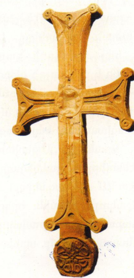
Խաչաձև ղուռ, Դվին, VII դար