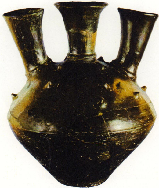
ՄԱՓՈՐ - ԿԱՆԱՑԻԱԿԵՐՊ ԿՈՒՌՔ Դվին, ք.ա. X - IX դդ., կավ, 47 x 35 սմ ՀՊԹ № 2121-286

Անտրոպոմորֆ կուրք է՝ դեպի երկինք ուղղված թևերով և գլխով: Շեշտված կանացի հատկանիշները լայնակոնք իրանը և ստինքանման տասնվեց ուռուցիկ ելուստները, խորհրդանշում են Մայր աստվածությունը: Հին հավատալիքների պատկերագրմանը բնորոշ է կեցվածքը՝ հմայական աղերսով դեպի երկինք կառկառած թևերով: Կուրքը անկասկած կապվում էր բնության զարթոնքի, պտղաբերության, բուսական ու կենդանական աշխարհի բարօրության գաղափարի հետ: Այն իր մեջ կրում է հայոց Անահիտ աստվածուհու պաշտամունքի տարրերը: