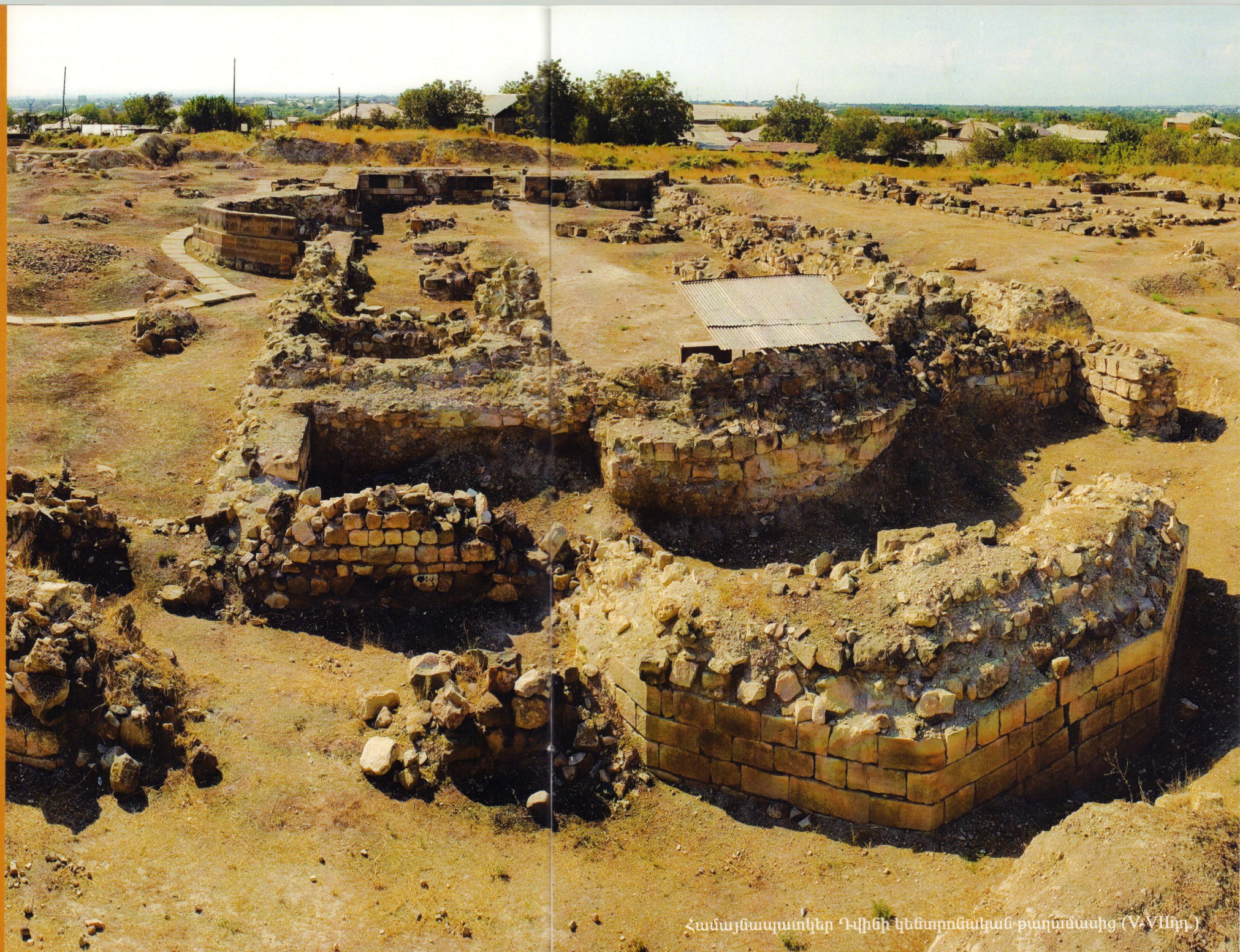
Համայնապատկեր Դվինի կենտրոնական թաղամասից (V-VIIIդդ.)