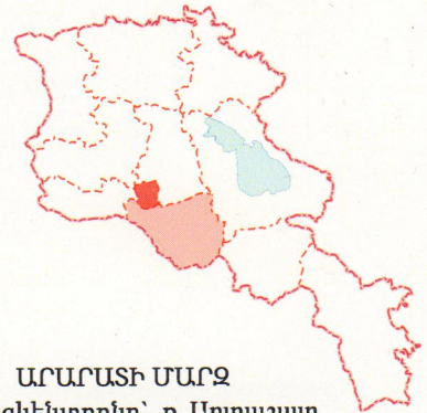
ԱՐԱՐԱՏԻ ՄԱՐԶ Մարզկենտրոնը՝ ք. Արտաշատ

Արարատի մարզի տարածքում են գտնվում Հայաստանի երկու հնագույն մայրաքաղաքները՝ Արտաշատը և Դվինը: