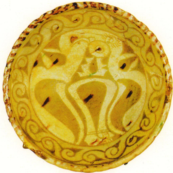
ՊՆԱԿ ԶՆԱՐԱԿԱԿՈՍ Դվին, XII - XIII դդ., կավ, 18 x 7 սմ ՀՊԹ № 2048-233

Շրջանաձև, ջնարակապատ պնակ է՝ ուղիղ եզրակողերով, օղակաձև ցածր ոտքով: Պնակի նկարազարդված կենտրոնում զինանշանային հորինվածք է՝ ոճավորված արծվի պատկերով: Թռչունը նստած է թևատարած, գլուխը աջ թեքած: Կտուցը երկար է, կեռ, գլխին կրում է ծաղկանման գլխազարդ: Արծվի պատկերը բլրորված է սրակտուց թռչնագլուխների շարքով: Նկարազարդումն արված է սպիտակավուն հիմքի վրա դարչնագույնի երանգներով և տեղ-տեղ շագանակագույն վրձնահարվածներով: