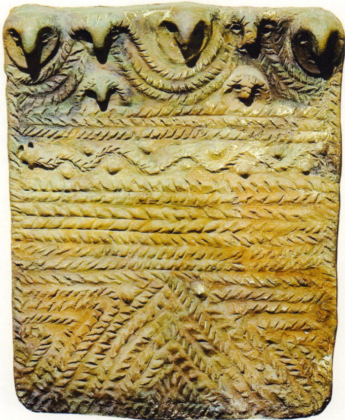
ԾԻՍԱԿԱՆ ՊԱՏԿԵՐԱՏԱԽՏԱԿ Դվին, ք.ա. X – IX դդ., միջնաբերդի ստորին շերտ կավ, 50,5 x 63,5 սմ ՀՊԹ № 2846

Կրակի պաշտամունքին նվիրված սրբարաններում տեղադրված նման քանդակագարդ պատկերատախտակները ներկայացնում են Արարատյան հարթավայրի հնագույն բնակիչների հողագործական պաշտամունքների հետ կապված հավատալիքներն ու աստեղային պատկերացումները: