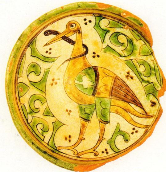
ՊՆԱԿ ԶՆԱՐԱԿԱԿՈՍ Դվին, XII - XIII դդ., կավ, 21 x 9 սմ ՀՊԹ № 1794-314

Ջնարակապատ պնակ է՝ ուղիղ բարձրացող եզրակողերով և օղակաձև ցածր ոտքով: Անոթի ներսում պատկերված է կիսադեմով կանգնած արագիլ, որի կտուցի մեջ գալարվում է օձը: Վերջինիս պոչը փաթաթված է թռչունի վզին: Ռեալիստորեն ներկայացված է խոշորամարմին, երկարոտն գորեղ թռչնի կերպարը: Փոքր գլխի վրա նշված է այքը: Շնորհիվ է գցուն կրծքամասը, հզոր թևերը, ոտքերի ճանկերը: Արագիլի թևի վրա պատկերված է շուշանածաղիկ: Այս հորինվածքի շուրջ երեքական մուգ շագանակագույն կետազարդերից կազմված զարդախմբեր են և ոճավորված բուսական կանաչ զարդաձևեր: