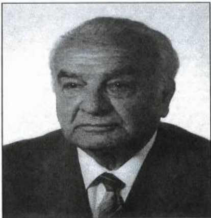
Փրոֆ. Ալեոիս Փափազեան