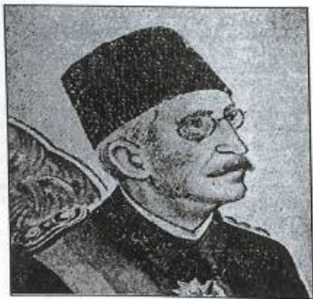
Սուլբան Մեհմետ Շրդ Վահիստատիմ (Գահակալութիւնը՝ 1918-1922 թթ.)