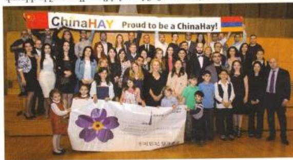
Չինաստանի հայկական համայնքը Նանձինում մշակութային միջոցառումներ է անցկացնում: