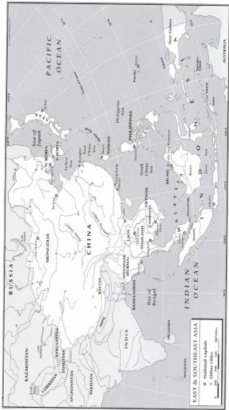
1 Map of China and East Asia, Current History, Volume 115, Issue 782

ՉԻՆԱՍՏԱՆԻ ՄԵԿ ԳՈՏԻ, ՄԵԿ ՃԱՆԱԳԱՄԸ, ՆԱԽԱԶԵՆՈՒԹՅՈՒՆԸ ԵՎ ՀԱՅԱՍՏԱՆԸ