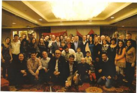
Չինաստանի հայկական համայնքի հավաքույթ Գուանչոու քաղաքում: Ներկա են Շանհայում, Հոնկոնգում, Լանծինում, Գուանչոուում, Ֆոշանում և այլ քաղաքներում բնակվող հայեր: