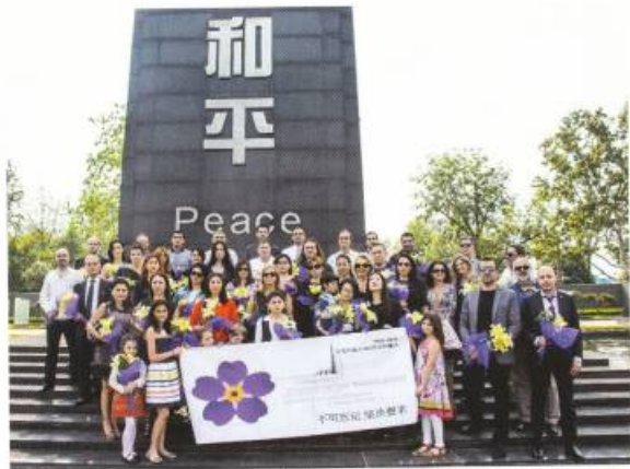
Չինաստանի հայկական համայնքը Նանձինի կոտորածների թանգարան-խնտիտուտում անցկացնում է Հայոց ցեղասպանության գոհերի հիշատակին նվիրված միջոցառումներ. 2015թ.:

Ճայժմ, նույնիսկ Չինաստանի մուտքի արտոնագիր ստանալու դեպքում՝ ՀՀ քաղաքացիներն պարտավոր է հավելյալ