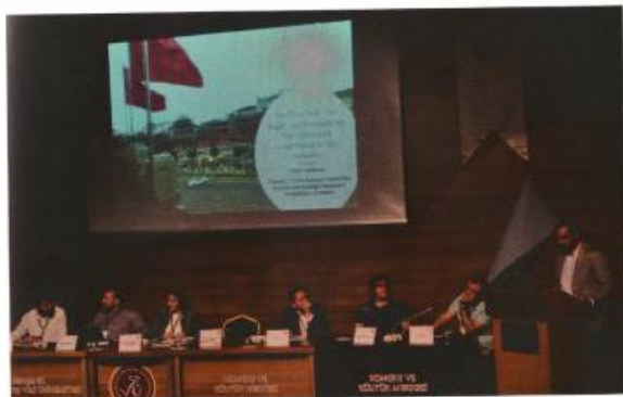
Մհեր Սահակյանը ելույթ է ունենում ՄԳՄՃ-ում Հայաստանի ներգրավման հեռանկարների շուրջ՝ Նեշեիլիի համալսարանում տեղի ունեցած «Չինաստան և Մերձավոր Արևելք» չորրորդ գիտաժողովում, 2018թ.: