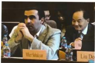
Շանհայի համալսարան, «Չինաստան և Մերձավոր Արևելք երրորդ գիտաժողով» իրավիրյալ բանախոսներ Մհեր Սահակյանը և Մերձավոր Արևելքում Չինաստանի հատուկ պատվիրակ Վու Սիկը, 2017թ.: