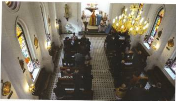
Չինաստանի հայկական համայնքը Գուանչոու քաղաքում հայկական պատարագ է կազմակերպել. 2014թ.: