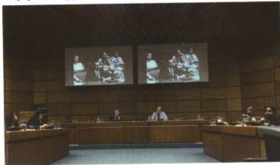
Միավորված Ազգերի Կազմակերպության համաժողովում (Վիեննա) Մհեր Սահակյանը մասնակցում է քննարկման նվիրված միջազգային անվտանգության հիմնախնդիրներին, 2018թ.: