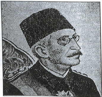
Սուլթան Մեհմետ Երդ Վահիտետտին (Գահակալութիւնը՝ 1918-1922 թթ.)