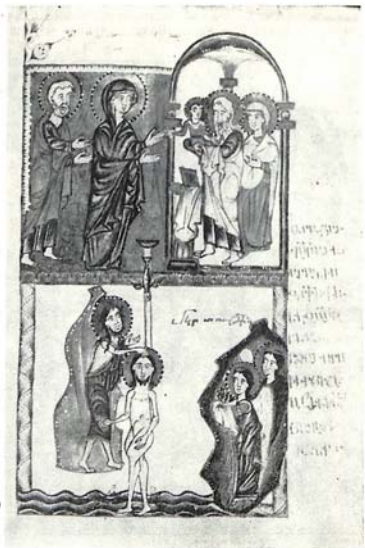
Рис. 3. «Сретение» и «Крещение».

апостолов, смотрящих на возносящегося Христа. Границей между небом и землей служит тонкий золотой орнамент. Миниатюры евангельского цикла Мануэл завершает сценой Сошествия св. Духа. Здесь с правой стороны изображен апостол Симеон-Петр, над которым имеется надпись «Спос».