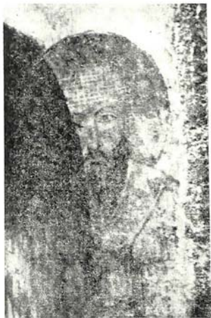
Рис. 4. Кирилл Александрийский

ности). Надписей около изображений нет, но иконография ряда святителей достаточно определена и позволяет узнать в них: Григория Богослова, Василия Великого, Иоанна Златоуста и Кирилла Александрийского (рис. 4).