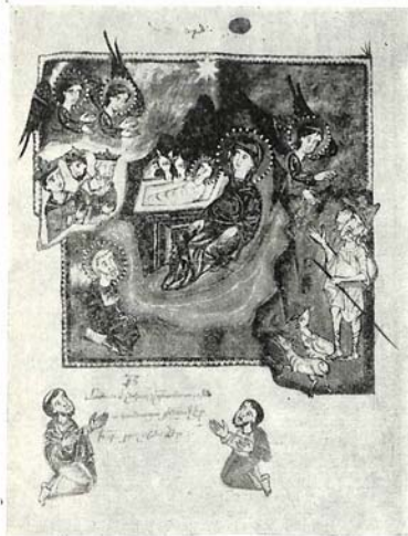
Рис. 2. «Рождество».

Пышность цветовой гаммы в нижней части композиции, отягощённой золотым фоном, сменяется постепенным высветлением и облегчением в верхней ее части. Вверх направлены и движения