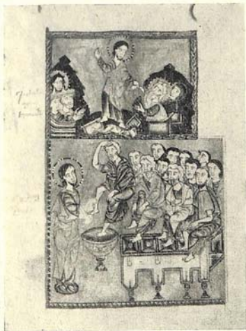
Рис. 4. «Сошествие во ад» и «Омовение ног».

Миниатюры Мануэла, при всем своем своеобразии, отмечены определенным сходством с работами Саркиса Пицака, которые особенно часто копировались. Рукописи его бытовали во многих скрипториях как в Коренной Армении, так и в армянских колониях и поселениях.