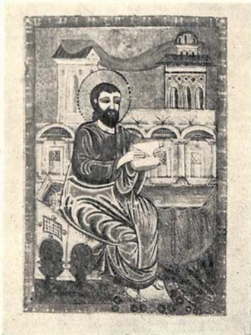
Рис. 7. «Евангелист». Миниатюрист Агамал. Рук. 7640.

Многим армянским средневековым миниатюристам пришлось много странствовать по свету, их неразлучными спутниками были палитра, краски и кисти. И на новом месте они продолжали создавать рукописи. Таким был исфаганский миниатюрист Мкртыч, получивший специальное образование в Алеппо и обосновавшийся затем в Тбилиси. 13