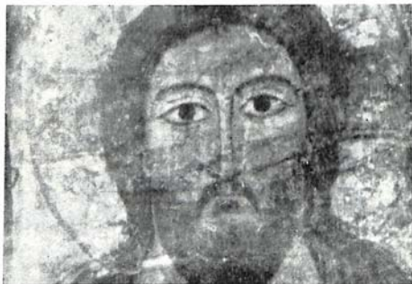
Рис. 2. Голова Христа из «Евхаристии».

Как известно, большинство армянских храмов имеет по одному окну в апсиде. Исследователи склонны связывать эту особенность с монофизитством армянской церкви. 10 В отличие от армянских, православные храмы, начиная с первой четверти VI в., имели обычно по три окна. В Кобайре же мы видим пять окон: три, как было принято в диофизитских церквях, и еще два сверху. 11 Назначение этих верхних окон не вполне понятно; несомненно, однако, что они сильно мешали установившейся иконографической схеме росписи. Вклинившись в самый центр апсиды и