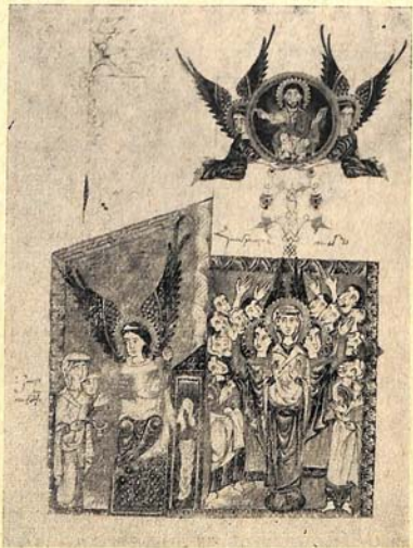
Рис. 5. «Воскресение» и «Вознесение».

Наряду с определенным влиянием работ Саркиса Пицака, миниатюры Мануэла несут на себе следы общности с искусством книжной живописи Сиванна-Ахпата. В частности, много точек соприкосновения имеется между работами Мануэла и сиваннского миниатюриста Иоанна (Ованнесса). Возможно даже, что Мануэл искусству книжной живописи научился в Сиванне. Миниатюры лекционного, созданного в Ахпате и украшенного в 1458 г. Мануэлом, напоминают работы Иоанна из Сиванна. Эту рукопись