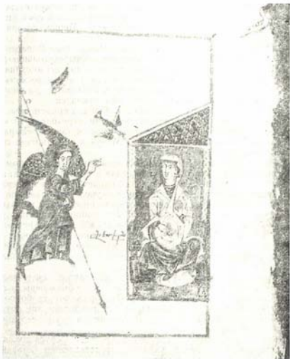
Рис. 1. «Благовещение».

Канонично представлено Распятие. Ниже, на той же странице, — «Похороны». Здесь изображен также последний получатель рукописи Саркис.