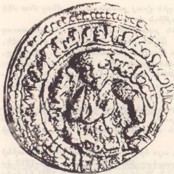
Պղինձ գրամ էլ Աշրաֆի