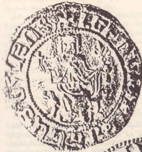
Լեւոն Ա. Ամենայն Հայոց Թագաւոր

Յատկապէս Լեւոն Ա. ի գահակալութեան շրջանին, (1199-1219), երկու այլ երկրամասերու տիրակալներ իրենք զիրենք կը յայտարարէին որպէս «Հայոց թագաւորներ»: Այդ երկրամասերն էին Վասպուրականի վրայ իշխող Շահ Արմէնները եւ