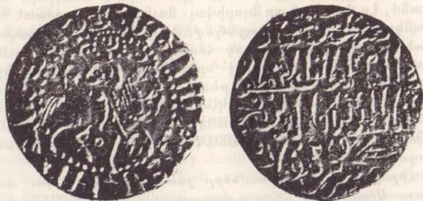
Նկար թիւ 2