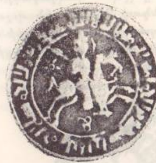
Նկար թիւ 3

Սակայն դրամի շահագործման ամենացայտուն օրինակը, որպէս վաճառականութեան թափանցումի միջոց, կը գտնենք խաչակիր իշխաններու մօտ, որոնք ԺԲ. դարու սկիզբէն սկսեալ, ոսկիներ հատանեցին յար եւ նման իսլամական