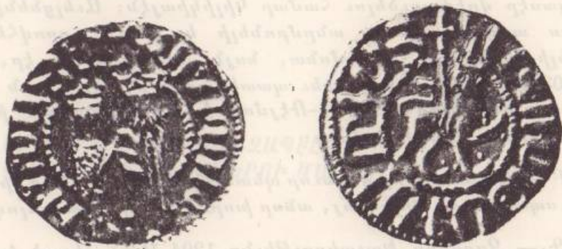
Նկար թիւ 1

մը: Շուրջը՝ ՀԵԹՈՒՄ ԹԱԳԱԻՈՐ ՀԱՅՈՅ (տարբերակներով), առանց Չապէլ թագուհի անուան յիշատակութեան (տես՝ նկար թիւ 1):