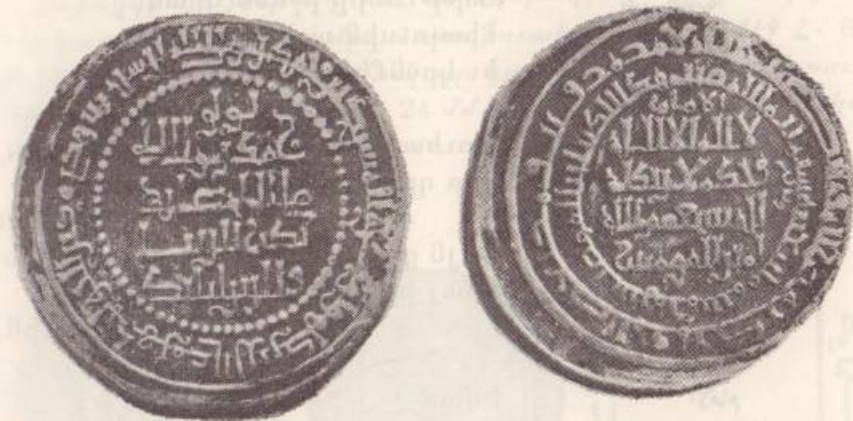
Նկար թիւ 2

ոսկեդրամի մը՝ իր մակագրութիւններով (տես՝ նկար թիւ 2): Դրամին վրայ Լուլուի անունը յիշուած է արքայի տիտղոսով, որպէս կրօնքի եւ աշխարհի լիալուսին (12) :