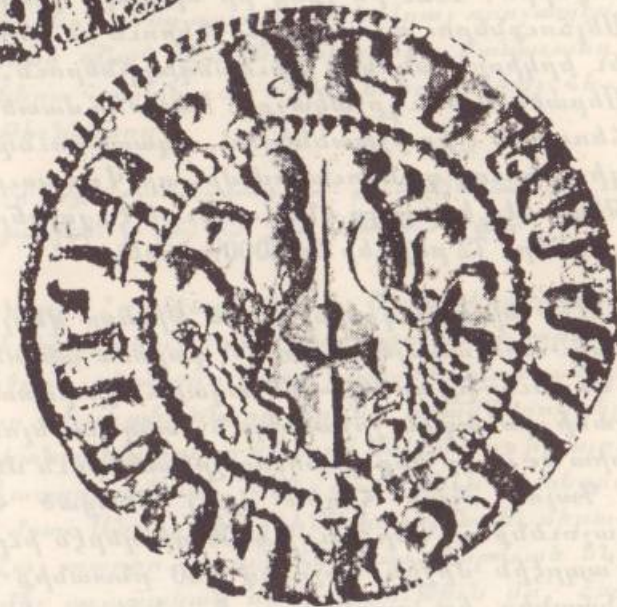
Անիի ու անոր շուրջ հաստատուած Չաքարեանները, որպէս Շահնշահ՝ թագաւոր, աշխարհակալ եւ կայսր Բագրատունեաց Տան: