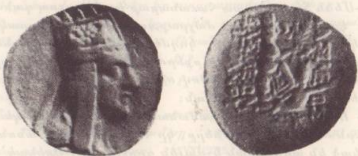
Տիգրան Բ.ի արծաթ տրախմին (Տրամագիծը բազմապատկուած երկու անգամ)

Թէեւ աղբիկեան օրինաւոր կշիռով տրախմիները պէտք է կշռեն 4.36 կրամ, սակայն գործնականօրէն կարելի չէ եղած միօրինակ եւ հակակշռուած ձեւով դրամներ հատանել: Տիգրան Մեծի յաջորդ՝ Արտաւազդ Ա.ի օրով տրախմիները կը տարուբերին 3.62 եւ 3.49 կրամի սահմաններուն մէջ: