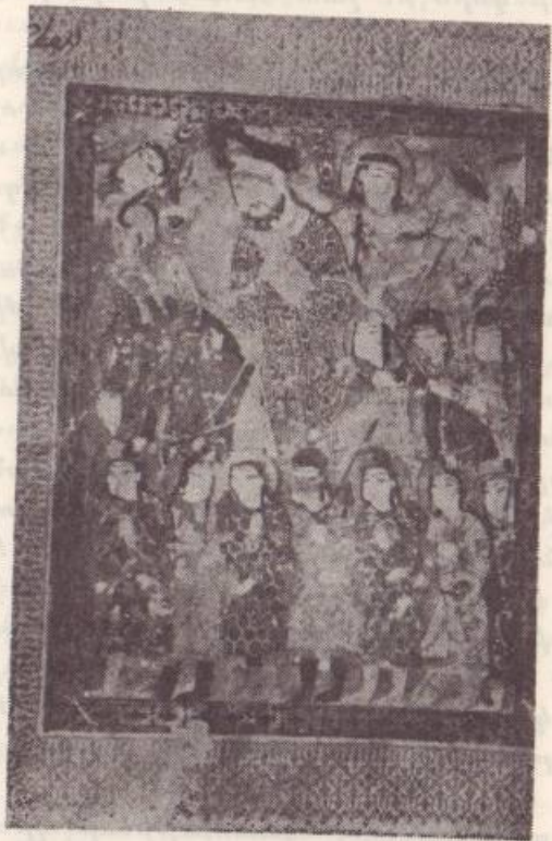
Նկար թիւ 1

Արեւելքի, Խաչակիրներու, Հայաստանի եւ Կիլիկիոյ պատմական իրադարձութիւններուն կապակցութեամբ: