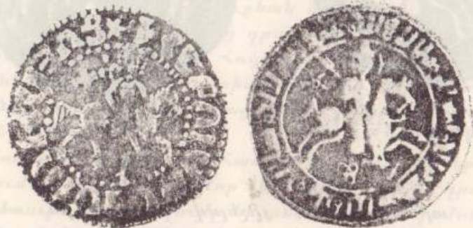
Նկար քիւ 5

սպառնալիքները մնացին ապարգիւն, մինչեւ որ Ֆրանսայի թագաւոր Լուի Թ. նոր խաչակրութեամբ հասաւ Սուրիա եւ այցելեց Թրիփոլի ու Աքքա: Իրեն կ'ընկերանար պապական նուիրակ Լեկաթ Շաթորու, որ մանրամասն տեղեկագրով գայթակղութիւնը յանձնեց Իննոկինզոս Դ. պապին ուշադրութեան: Բանադրանքի թուղթեր զրկուեցան Թրիփոլիի եւ Աքքայի իշխաններուն, որոնք 1250 թ.ին գաղղբեցուցին արաբատառ օսկիներու հատանումը(28):