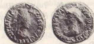
Նկար թիւ 4

խոյրի: «Վարսերը հաւաքած են գլխի շուրջ ժամանակակից բարձրաստիճան հռոմէուհիներու վարսայարդարման օրինակով: Այդ արտայայտում էր հռոմէական ճաշակի եւ ազդեցութեան ներթափանցումը Հայաստան» (3) : Դրամին շուրջ գրուած է ΕΡΑΤΩ ΤΙΓΡΑΝΟΥ ΑΔΕΛΦΗ (Երատոյ քոյր Տիգրանի (նկար թիւ 4):