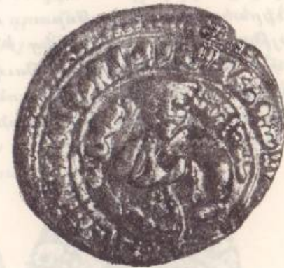
Նկար թիւ 4

Փաթիմի տինարներուն, յիշելով մարգարէին անունը, Հիճրի տարեթիւերը եւ իսլամական հաւատոյ հանգանակը: Հարիւր եւ աւելի տարիներ անոնք շարունակեցին այս դրամներուն հատանումը՝ մանաւանդ Թրիփոլիի եւ Աքքայի փողերանոցներուն մէջ: Սկզբնական շրջանին խաչակիրները հաւանաբար ունեցան քուֆի գրեւակերպին վարժ փորագրիչներ, որոնք Փաթիմի ոսկիները ընդօրինակեցին հարազատօրէն: Վերջին շրջանին սակայն, անվարժ ձեռքեր բաւականացան քուֆի գիրերու տեղ զծիկներ դրոշմելով, որոնք թէեւ անընթեռնելի եւ անիմաստ՝ սակայն եւ այնպէս, իրենց արտաքին երեւոյթով խաբուսիկ՝ հարազատ տինարի տպաւորութիւն կը ձգէին անզրազէտ եւ անուս զանգուածներուն վրայ: