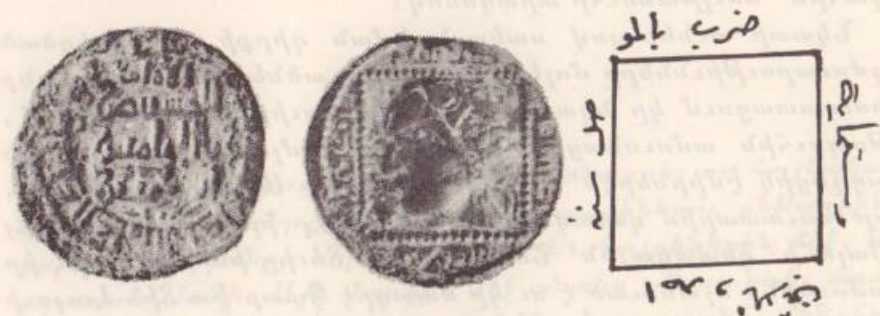
Նկար թիւ 3

Հայագգի Լուլուի պղինձէ պատկերադրոշմ ֆիլիսներէն կը ներկայացնենք նմոյշ մը, հատանուած Մուսուլի մէջ 2. 631 թ.ին (1233 թ.), ուր գահակալը կը ներկայանայ անմօրուս: Ֆիլսը կը կշռէ 7.50 կրամ, 24 մմ. տրամագիծով (տես՝ նկար թիւ 3):