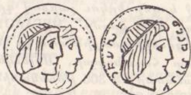
Նկար թիւ 3

Մասնաւոր նշանակութիւն ունի եզակի պղինձ դրամ մը, որ կը գտնուի Բարիզի Պետական թանգարանին մէջ, ուր Տիգրան Դ. կը ներկայանայ հայկական խոյրով դէպի աջ՝ եւ Արքայից Արքայ (ΒΑΣΙΛΕΥΣ ΒΑΣΙΛΕΩΝ ΤΙΓΡΑΝΗΣ) տիտղոսով: Իսկ յետսակողմը Երատոյ թագուհին ձախ դարձած, առանց