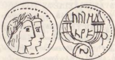
Նկար թիւ 2

Հաւանական պիտի ըլլար ենթադրել թէ այս դրամները հատանուած են Տիգրան Դ-ի եւ Երատոյի ամուսնութեան, եւ կամ ալ գահակալութեան խնդակցութիւններուն առիթով: Այլապէս հետքը քրական երեւոյթ մըն է ա'յն որ, օրինակ, Նապաթէական դրամաշարքէն, նոյն շրջանին յատուկ կարգ մը դրամներ կը կրեն զուգակից կիսանդրիններու դրամներ, օրինակ՝ Օպոտաս Գ. եւ Շաքիլաթ (Ք. Ա. 30 - Ք. Ե. 9 թթ.) (նկար թիւ 2), Արեթաս Դ. եւ Շաքիլաթ (Ք. Ա. 9 - Ք. Ե. 40 թթ.) (նկար թիւ 3): Նմանօրինակ դրամներու հատանումը, այն շրջանին, կրնար նաեւ վարակիչ նորածեւութիւն մը ըլլալ, քանի որ Տիգրան Դ-ի նախորդներէն եւ ոչ մէկը նման դրոշմով դրամներ հատանած է, տեղ տալով թագուհիին կիսանդրին: Պատմագիտական փաստեր չկան որ Նապաթէական արքայատոհմը արիւնակցական ամուսնութիւններ կնքած է (2) :