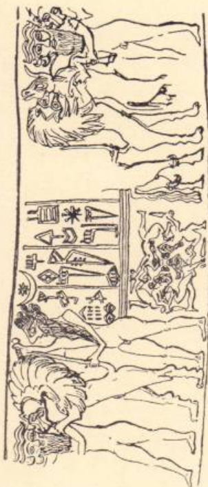
3. Մեռելների հարստացումը, աշխարհում Գիլգամեշը, ձախում՝ Էնկիդուն

— Դուստր իմ, փափազդ կը կատարեմ, բայց այս բանը յոթը տարի սովի պատճառ կը դառնա: Մարդոց համար բավականաչափ հացահատիկ և