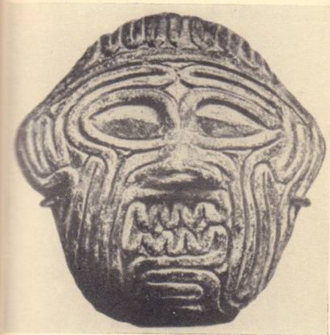
2. Խումբաբայի գլուխը

Երկուքն ալ կանաչ լեռը հասան և իրենց խօսակցութիւնը դադրեցավ: