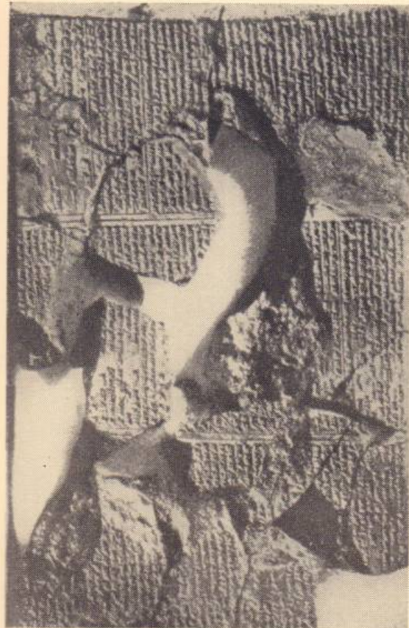
4. «Գիլգամեշ» դյուցազներգության պեմփրոններից մեկը

— Ուրուկի պարսպների վրա ելի՛ր, Ուրշանա- բի, ելիր և տես, թե որքան ամուր են շինված, քննե անոնց հիմքը, տե՛ս, թե արդյոք թրծված աղյուանի-