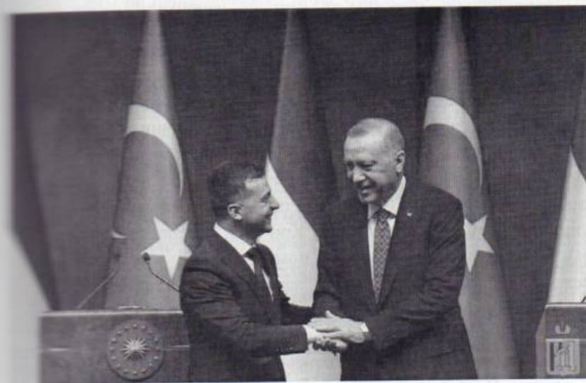
Президентов Украины и Турции Владимира Зеленского и Реджепа Тайипа Эрдогана связывают теплые, дружественные отношения