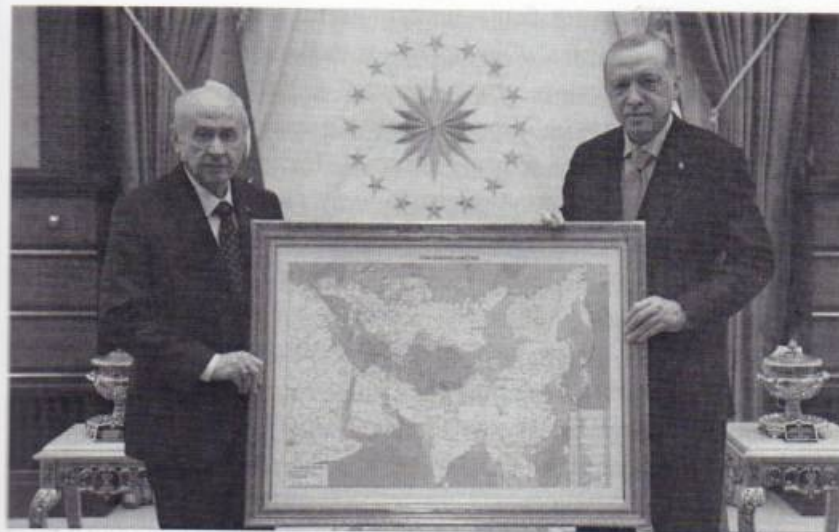
Лидер Партии националистического движения Девлет Бахчели презентует президенту Турции Реджепу Эрдогану «карту тюркского мира», включающую ряд российских регионов и бывших советских республик (ноябрь 2021 г.)