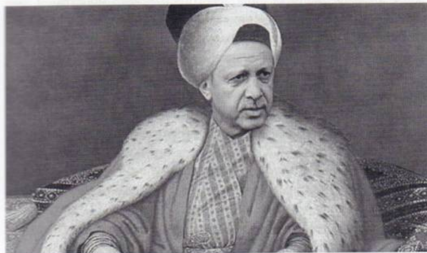
Изображение президента Турции Реджепа Тайипа Эрдогана, реализующего концепцию неоосманизма, в султанском одеянии