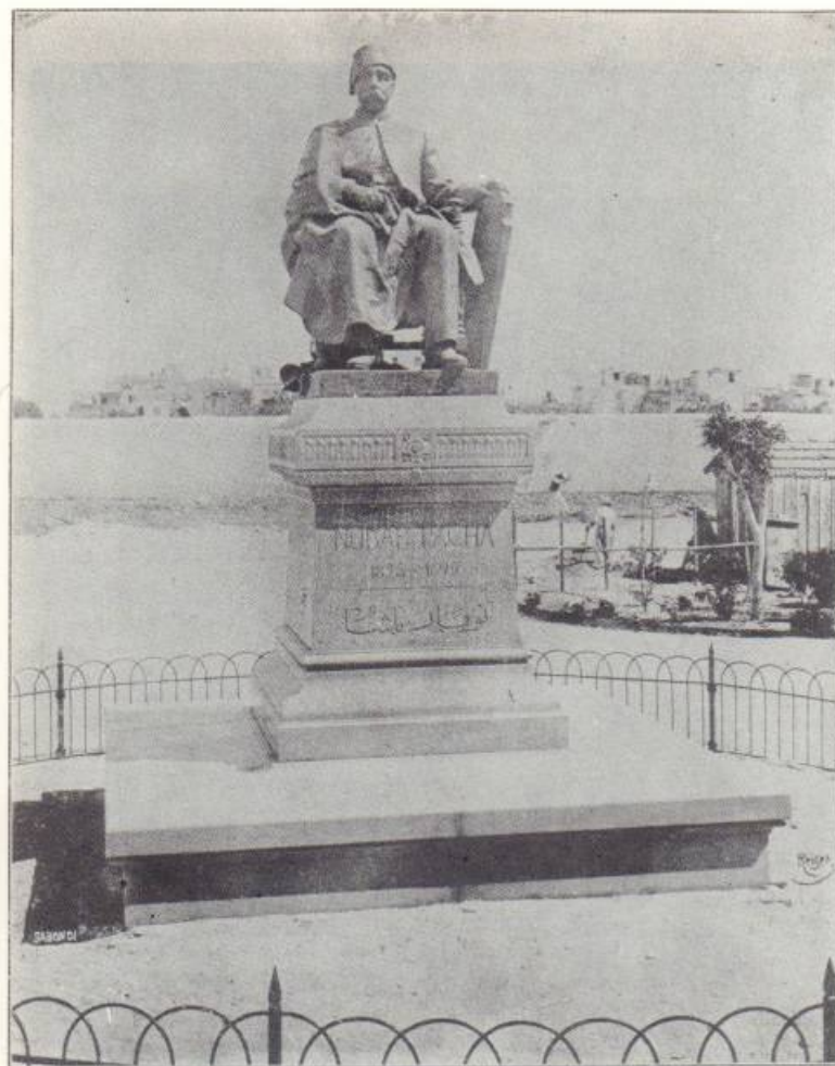
ՅԻՇԱՏԱԿԱՐԱՆ ՆՈՒՊԱՐ ԲԱՇԱՅԻ — MONUMENT DE NUBAR PACHA Աղեխանգրիա Ռիւ Տ'Ալլըմաներ 1904 Alexandrie Rue d'Allemagne