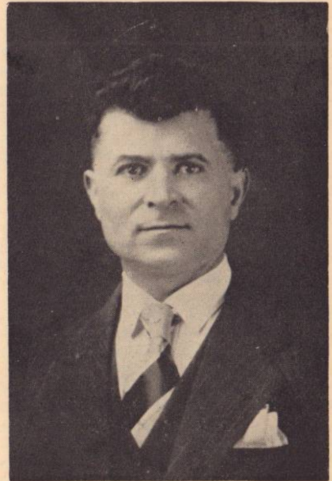
Ներկայ հատորը կը ձօնենք անմոռաց յիշատակին մեր թանկագին բարեկամին ու ընկերոջ՝ Գ. ԳԱՏԷԳՃԵԱՆԻ