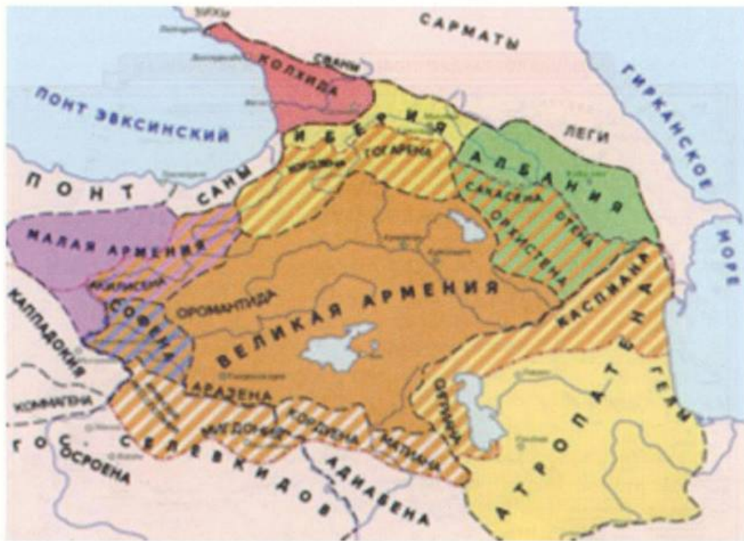
Закавказье после 66 г. до н. э. — «Всемирная история», т. II, М., 1956 г.