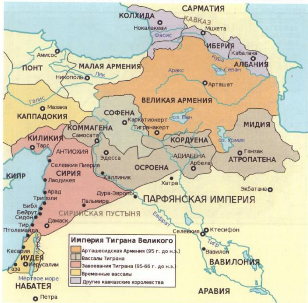
Map of the Armenian Empire of Tigrane II. Armenia: A Historical Atlas by Robert H. Newsen, Chicago, 2001, University of Chicago Press (336 pages, 232 color maps)